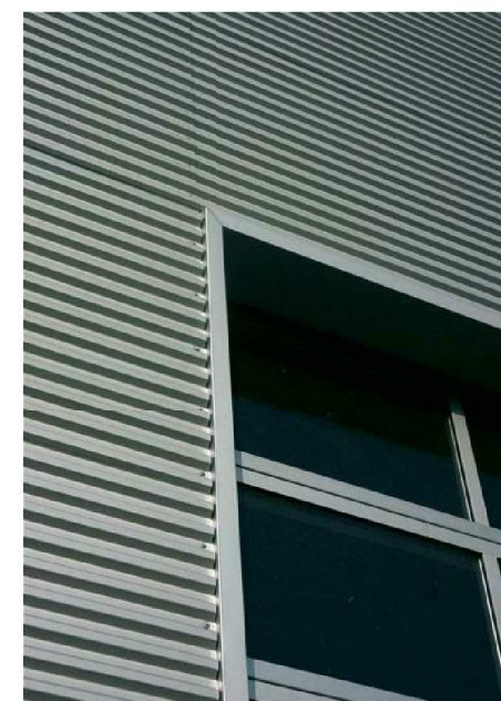
Foto geprofileerde stalen wandplaat 20-75 met coating in kleur n.t.b. Platen horizontaal te verwerken op verduurzaamde houten regels ca. 40 x 40 mm h.o.h. 600 mm.

Geprofileerde stalen wandplaat 20-75 met coating in kleur n.t.b. Platen horizontaal te verwerken op verduurzaamde houten regels ca. 40 x 40 mm h.o.h. 600 mm.